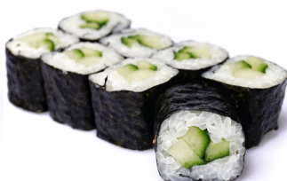
21. ●● Kappa Maki Gurke