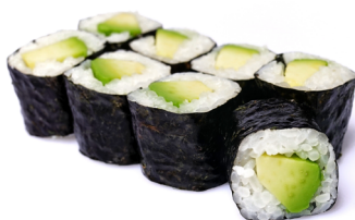
20. ●● Avocado Maki Avocado