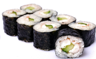
29. ● Ebi Maki Crevetten, Gurke