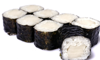
31. ● Kingfish Maki Kingfisch