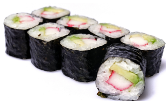
28. ● California Maki Surimi*, Avocado