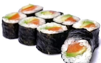
27. ● Sake-Avo Maki Lachs, Avocado