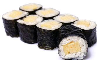
22. ● Inari Maki eingelegter Tofu, süß