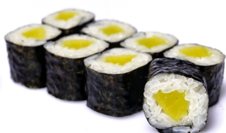
24. ●● Oshinko Maki jap. Rettich, süß