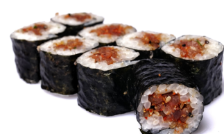
33. ● Spicy Tuna Thunfisch, Chili, Lauch