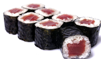
32. ● Tekka Maki Thunfisch