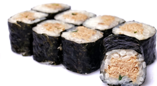
35. ● Tuna Roll Thunfischcreme, Lauch