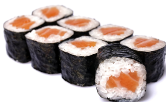
26. ● Sake Maki Lachs