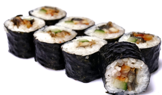
30. ● Unagi Maki grillierter Aal, Gurke