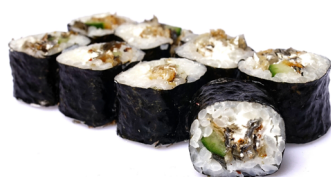
34. ● Salmonskin gebratene Lachshaut, Gurke, Frischkäse